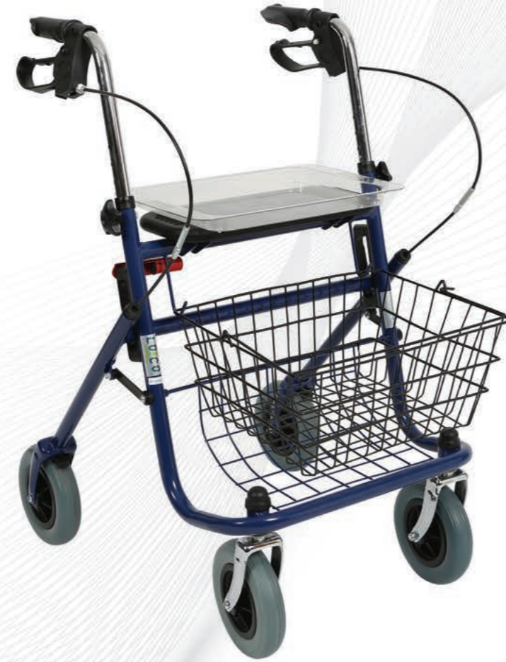
PR882 Hafif Alüminyum Rollator