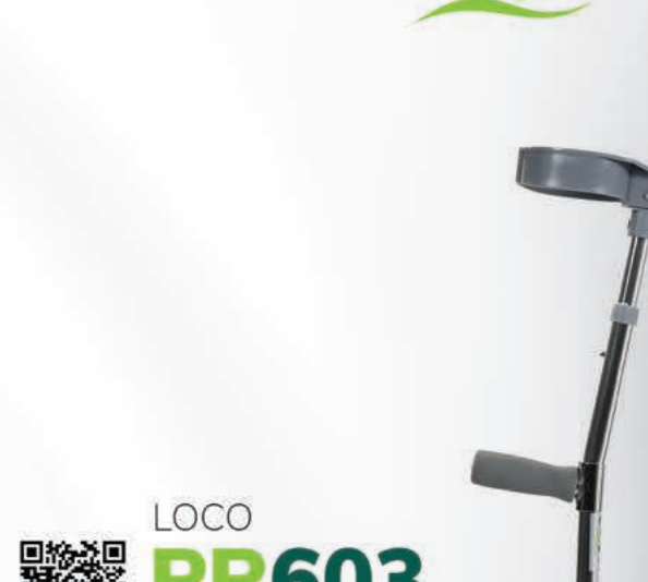
LOCO PR603 Alüminyum Kanedyen

Barkod No : 8698785010899 SUT Kodu : OP1011