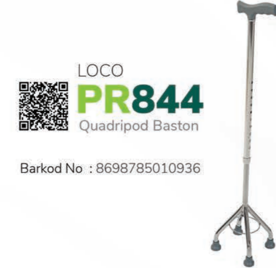
LOCO PR844 Quadripod Baston