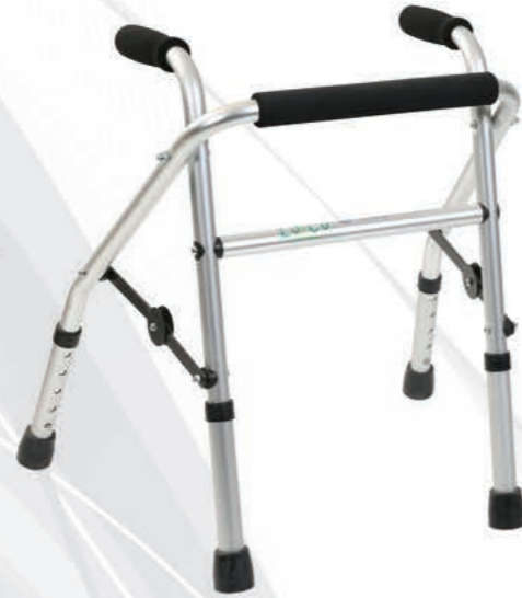
LOCO PR447 Alüminyum Walker (Bronz)

Barkod No : 8698785010981 SUT Kodu : OP1106