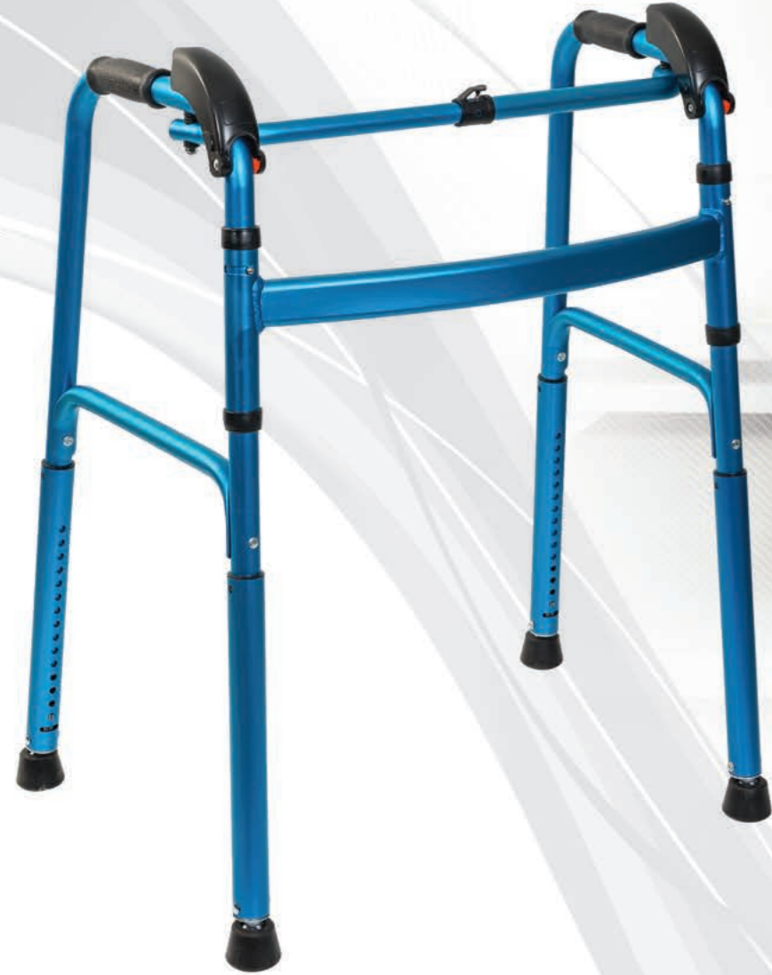
LOCO PR491 Alüminyum Walker (Merdiven Tipi)