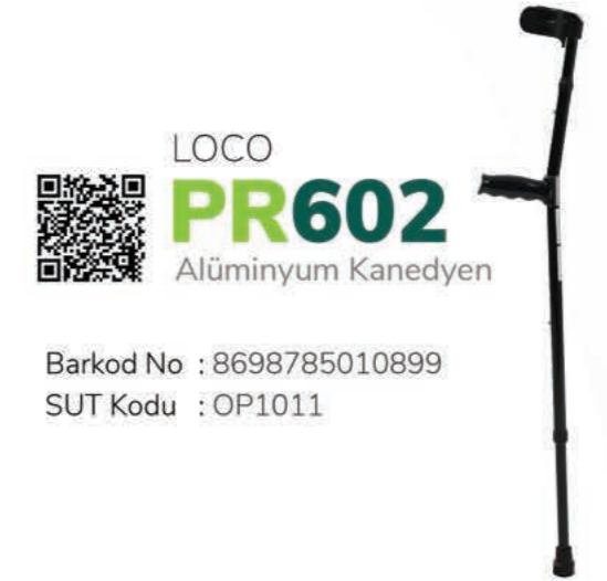
LOCO PR602 Alüminyum Kanedyen

Barkod No : 8698785010899 SUT Kodu : OP1011