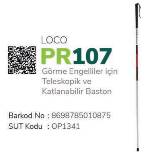
LOCO PR107 Görme Engelliler için Teleskopik ve Katlanabilir Baston

Barkod No : 8698785010875 SUT Kodu : OP1341