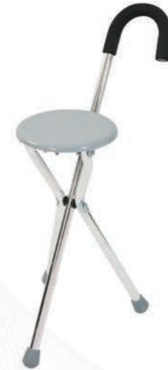
LOCO PR106 Alüminyum Oturaklı Baston