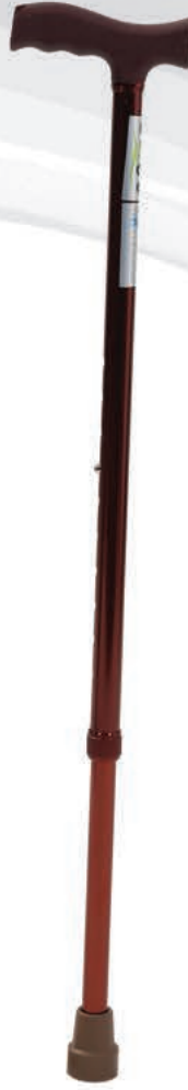
LOCO PR102 Alüminyum Baston(Bronz)